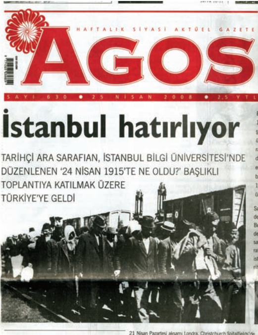
Agos gazetesinin 25 Nisan 2008 tarihli ön sayfası.

Agos gazetesinin 25 Nisan 2008 tarihli nüshasının ilk sayfasındaki fotoğraf, meçhul bir yere götürülmekte olan bir erkek kafilesini göstermekte. Aynı fotoğrafın geri planında da iki tren vagonu görülmekte. Gazetede fotoğrafla ilgili herhangi bir açıklama yok, kaynak da belirtilmemiş. Fotoğrafın yayınlandığı Agos gazetesinin ilk sayfası, taşıdığı tarihten de anlaşılacağı üzere, 24 Nisan 1915 tarihinde başlayan ve "büyük felaket" ile sona eren Ermeni Tehciri'ni anan sayının ilk sayfası.