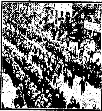
Nevyorkta Yahudiler tarafından Almanlar aleyhine yapılan büyük bir nümayiş

Almanya cebir ve şiddetle, Yahudiler para ile müthiş mücadelede devam etmektedirler. Hangisi galebe edecek? İşte çok sayı dikkat mesele... Almanlar Yahudilerin aleyhlerindeki boykotajlarını bırakmaları için Yahudilere üç günlük mühlet vermişlerdi. Bu mühlet yarın saat onda bitiyor. Eğer propaganda bitmezse yarın saat onda Almanlar bütün şiddetle elindeki 3,5 milyon Ya-