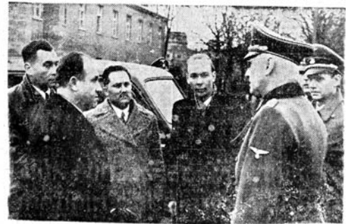
Emniyet Müdürümüz Berlinde istikbal edildiği sırada,

Berlinde bütün otomobillerde telsizle muhabere ediliyor. Alman generalinin göğsündeki Türk bayraklı madalya — Maskelenen bombardıman tahribatı — Göbels'in nutku — Rusyayı ziyaret