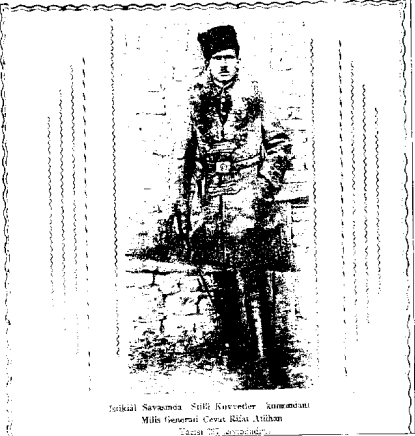
İstiklal Savaşına Sıkkı Kurucularından Millet Generali Cevat Rifat Atilhan Tarihçi, yazar ve askerdir.

Sebilürreşad dergisinin kapağında Cevat Rifat Atilhan'ın askerlik dönemine ait bir fotoğraf.