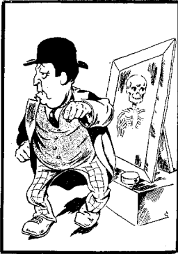
- A Diol -, entre le spectre de Djéved Rifat ?..