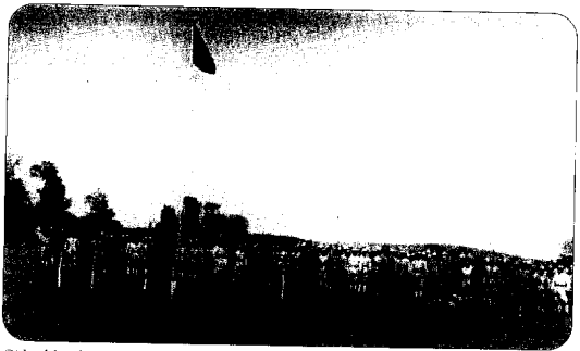
Gizli çekilmiş bir kamp resmi.

"Mantiken II. Dünya Savaşı süresince Türk Yahudilerinin korku içinde yaşamış oldukları düşünülebilir. Balkanların Nazi yönetimine geçişi.. Tarihten, birlikten kaynaklanan Alman Ordusu'na bazı kesimlerce duyulan hayranlık.. Basına yansıması.. 1941'de imzalanan on yıl süreli Türk-Alman Dostluk Anlaşması.. Bir iç darbe, bir Quisling 21 ihtimali gözardı edilecek bir tehlike değildi.. Üstüne üstlük ihtiyatlardan yirmi sınıfın birden askere alınışı ve Varlık Vergisi.. Tüm bunlara rağmen bu panik veya ciddi bir korkuya kapıldıklarını, durumlarının vahametini her kesimin aynı derecede algılayıp, aynı